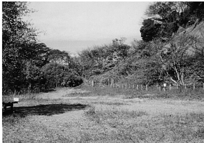
観察の森からの東京湾

コースは鎌倉と金沢文庫方面ともほぼ同じような環境です。鎌倉側に出ると寺院が多く楽しめますが、建長寺は通行料が必要です。建長寺の少し手前から瑞泉寺、鎌倉宮方面に下る道もあります。そして八幡神宮を見て小町通りを歩いて鎌倉駅に至る道が、野鳥の少ない分を楽しませてくれます。