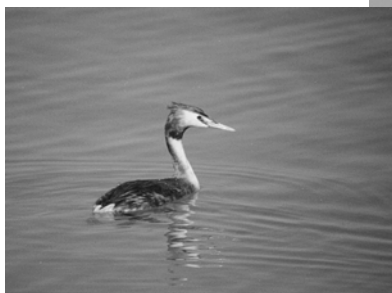
カンムリカイツブリ