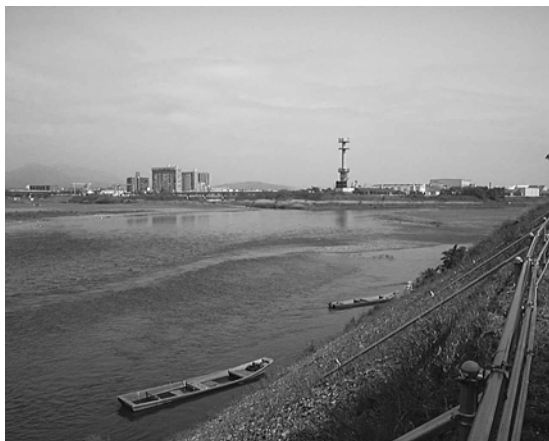
相模川 左：左岸より 下：水道橋

さて、100m ほど歩くと左に下りる小道があります。ちゃんとした道ではないので手すりのパイプをくぐって下りていくと小さな鳩川の流れにぶつかり、左に小道を進むと角材が渡してあるので注意して渡りましょう。この辺りも渡りの時期には見逃せないポイントです。このまま上流方向に向かうと、木立を抜けて左にまっすぐ川沿いに進む道と、右に小さな畑の横を進む道とに分かれます。どっちにいても合流できるのですが、この二つの道の間にある茂みにはジョウビタキ、アカハラ、アオジ、シメといった冬鳥が見られます。このあともう一度河原に下りてみましょう。イソシ