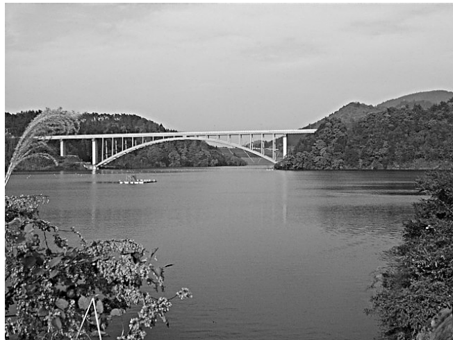
宮ヶ瀬湖 虹の大橋

途中の金沢橋から分岐する金沢林道は、舗装されてなく人が少ないため、オオルリやルリビタキを身近で見られることがあり、セキヤノアキチョウジ・テンニンソウ・ツリフネソウ・ハダカホオズキ・ホトトギス・サラシナショウマなど多くの草花もあります。