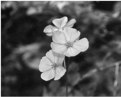
フシグロセンノウ