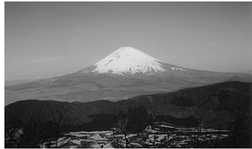
大涌谷からの富士山

帰りは、駒ヶ岳山頂からケーブルカーとバスを使うか、早雲山に出てケーブルカーと登山電車を利用する方法があります。(倉川典夫)