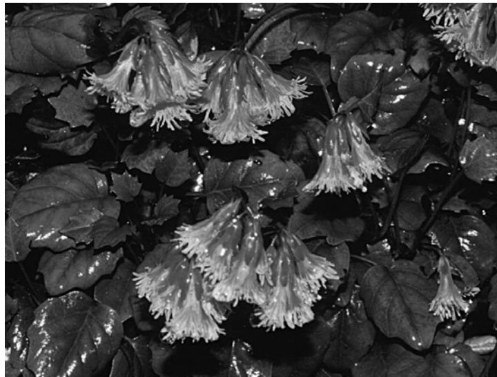
雨の日のヒメイワカガミ

山頂附近はバイケイソウが群生しています。気軽に登れるせいか、ハイカーが置いて行くゴミで汚れていてがっかりさせられます。下りはつい早足になってしましますが、道沿いの花を見ながらゆっくり歩けば思わぬ鳥に出会えるかもしれません。