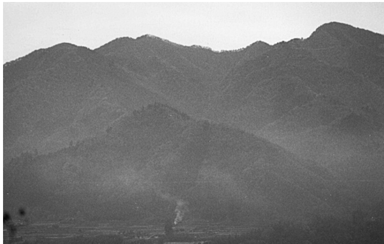
倉岳山（左）と高畑山